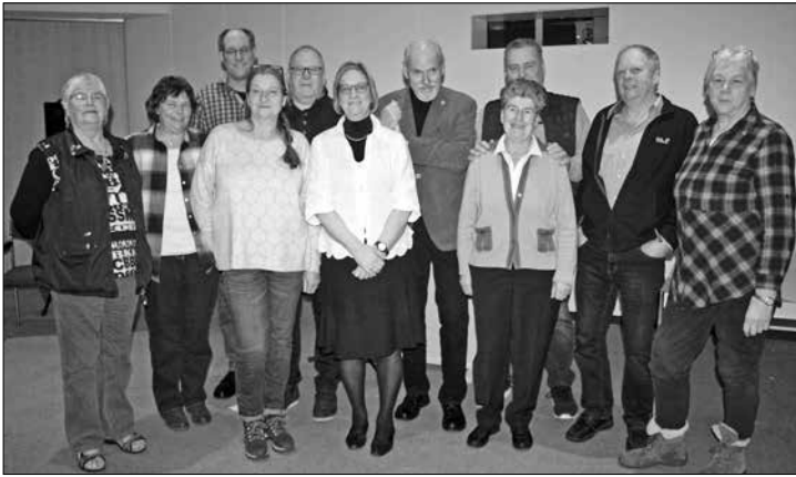
Der frisch gewählte Vorstand des Norderneyer Heimatvereins.